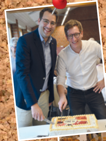
50 Jahre DBH Feier