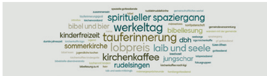
Eine Wortwolke zum „Gemeindeleben“ - entstanden am Klausurtag des Kirchenvorstandes

Auf Ihr Kommen und Ihr Einbringen freut sich der Kirchenvorstand.