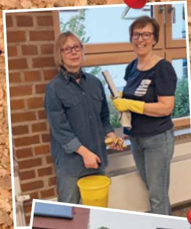
Die fleißigen Arbeiter am Werkeltag